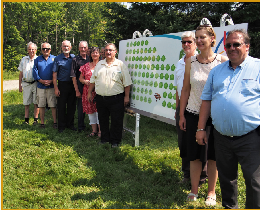
Les membres du cabinet