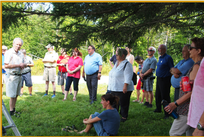
L'humidité ambiante rendait l'ombre particulièrement attirante