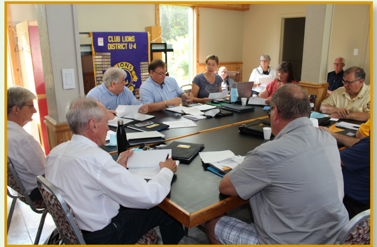
En pleine séance de travail